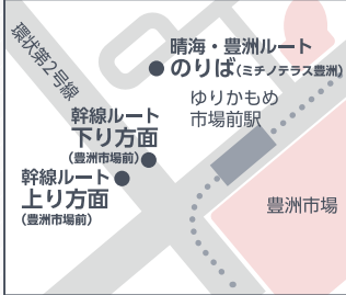
B03 豊洲市場前(ミチノテラス豊洲)