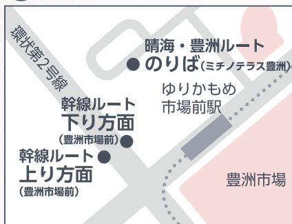
B03 豊洲市場前 (ミチノテラス豊洲)