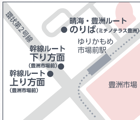
B03 豊洲市場前 (ミチノテラス豊洲)